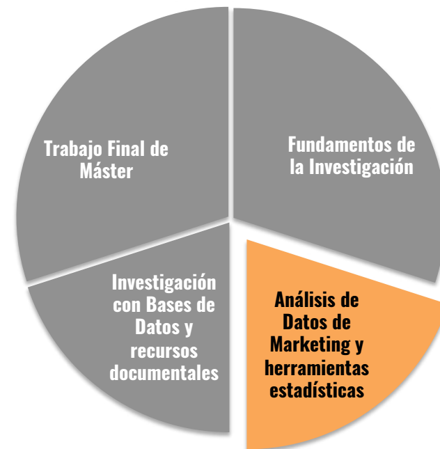
Segundo curso - Título de Máster en Estrategia, Creatividad y Herramientas de Marketing Digital

En este curso se trabajan en profundidad los conceptos básicos de la estadística descriptiva , así como algunas técnicas cuantitativas (cuestionario, etc.). También aprenderán a diseñar un experimento y a llevar a cabo las pruebas estadísticas inferenciales con el programa estadístico Jamovi